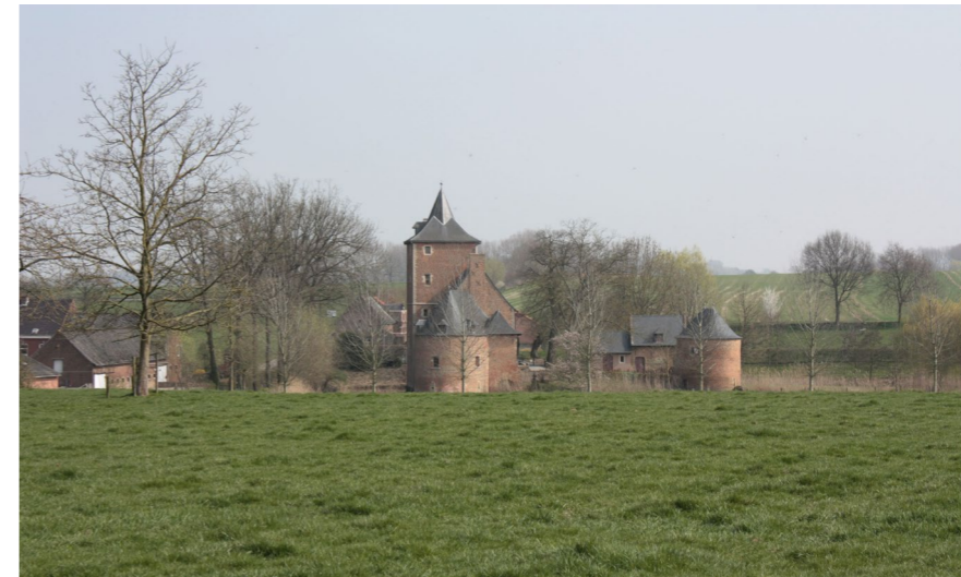
▲ Fig. 5 : vue de l'habitat seigneurial d'Oetingen.

Par contre, dans certains rares cas de sites de hauteur, la localisation de l'habitat seigneurial sur un sommet a été respectée, éventuellement parce que ce type de situation fait référence à des habitats plus prestigieux du Moyen Âge, tels que le château de Chimay (habitat de la haute noblesse, ancien comté de Hainaut), perché sur un éperon rocheux 39 . C'est le cas notamment de l'habitat seigneurial de Montignies-Saint-Christophe 40 (ancien comté de Hainaut), situé à l'extrémité d'un sommet rocheux formant un à-pic important par rapport au village situé en contrebas à l'ouest. La gouache 41 représente le domaine précisément depuis un point en contrebas, afin d'insister sur la situation en hauteur du site.