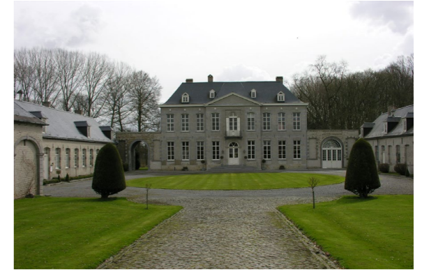
▲ Fig. 19 : vue de l'habitat seigneurial de la Cattoire à Blicquy.

Il est donc intéressant de relever que, dans le cadre de demeures seigneuriales qui ont entièrement disparu aujourd'hui ou qui ont été reconstruites, les gouaches peuvent fournir une idée de la typologie précédemment développée. Ainsi, dans les cas du domaine de Moustier 102 (ancien comté de Hainaut), reconstruit au XIX e et puis au XX e siècle, ou de celui de Fayt-lez-Manage/l'Escaille 103 (ancien comté de Hainaut), reconstruit aux XVIII e et XIX e siècles, les vues permettent de se faire une idée d'un état antérieur du domaine, qui n'aurait pas été connaissable autrement, sauf à y pratiquer des fouilles. Le cas du domaine de la Cattoire à Blicquy 104 (ancien comté de Hainaut) est intéressant car on constate que d'une ferme au XVI e siècle (fig. 18), le domaine devient un véritable habitat seigneurial au XVIII e siècle (fig. 19).